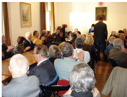
Detalj s predstavljanja