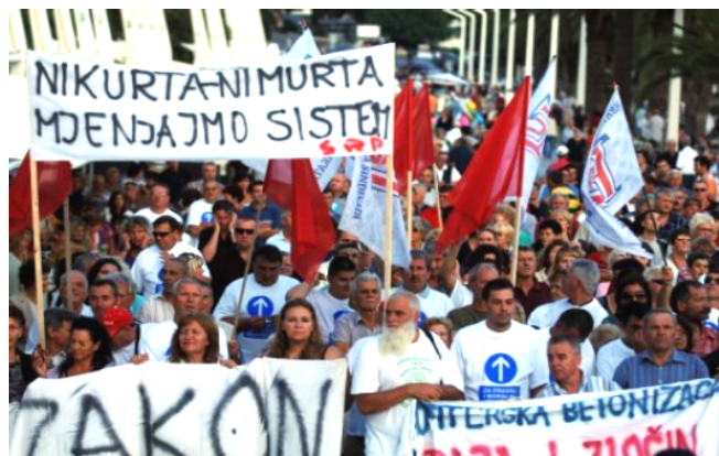
SRP na radničkim demonstracijama u Splitu 2009. godine

U slaganju i nagađanju sila preokreta mediji spominju i neke druge lijeve grupacije, ali Socijalističku radničku partiju nikako i nitko. SRP se dakle ubija šutnjom. Zašto? Zato što je Socijalistička radnička partija jedina stranka programski i organizaciono pozicionirana kao borac, ne samo za ekonomske, nego i za historijske interese rada i radnika, i smatra da rješenje povijesti može biti samo klasna borba i socijalizacija nasuprot privatizacije koja je u toku, bez obzira na to hoće li se se taj konačni rasplet dogoditi dijelom ili u potpunosti, na ulici ili u parlamentu. To naravno ovisi o zrelosti sukobljenih klasa. No, suprotno uvriježenom