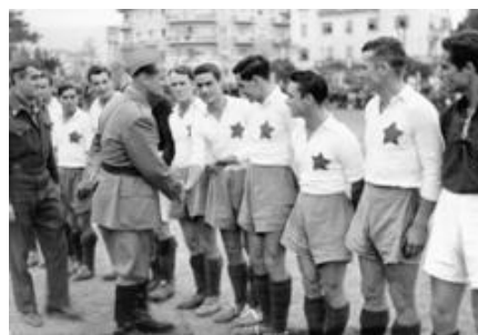
Uoči prve utakmice u oslobođenom Splitu

U El Shattu Hajduk je pobjedio reprezentaciju francuske kolonije Alžir, zbog čega je odlikovan Ordenom i tako postao počasna momčad Slobodne Francuske.