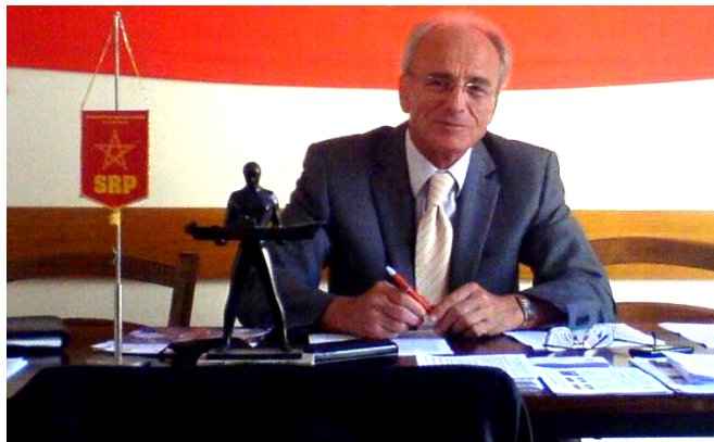
Ivan Plješa, predsjednik SRP-a

Na političkoj sceni Hrvatske predizborna je kampanja neslužbeno otpočela. Pljušte kritike teškog ekonomskog i socijalnog stanja, dozivlje se pravda i pravičnost, međusobni prijekori vođa pozicije i opozicije, pritvori se poneki lopov i tu i tamo otvori poneki pogon. Doimlje se čak da konačno moralna i etička pitanja dolaze na dnevni red. Neupućeni čak mogu povjerovati kako u politici nije sve sami crnjak i kako i tu ima neke čestitosti.