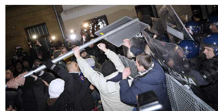
Ulični neredi zahvaćaju Hrvatsku