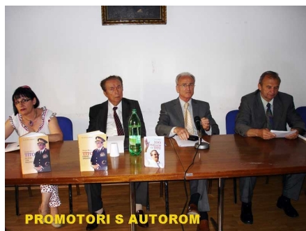
PROMOTORI S AUTOROM