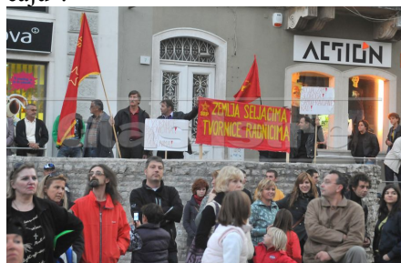
Demonstracije u Puli također poprimaju klasni karakter

uzimali letke iz ruku razumiju to, ostali su izgubljeni u svojim iluzijama ili su plaćeni da „ne shvaćaju“.