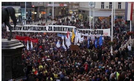
Hrvatska svjedoči stvaranju ozbiljnog i širokog fronta protiv kapitalizma, važno je jačati jedinstvo idejne platforme i akcijskog djelovanja

đana je sve veća, a u hrvatskom saboru se ni u tragovima ne vidi politička artikulacija njihovih interesa. Samoorganiziranje i ulične demonstracije su bile pitanje vremena, a određena iskustva su se stekla još ovo proljeće kada su okupljanja brzo poprimila lijevi, klasni karakter. Sada je to još izraženije. U Zagrebu, Splitu, Rijeci, Puli i drugim gradovima tisuće i tisuće demonstranta se ujedinjuje pod antikapitalističkim barjakom i nastoje iznaći model široke političke borbe sa jasnim socijalističkim sadržajem.