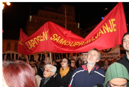
SRP je prirodno dio šireg projekta borbe protiv kapitalizma u Hrvatskoj, a za punu (samopravnu) demokraciju i oslobođenje rada

U tome je i Socijalistička radnička partija Hrvatske dala svoj doprinos, baš kao što to i druge ljevičarske partije i skupine rade drugdje u svijetu, pomažući da se održi ovaj plamen, po svom potencijalu, doista revolucionarnih gibanja.