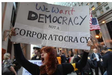
Ni u SAD-u puka politička demokracija više ne zadovoljava ljude, traži se puna demokracija i pravedniji sistem

Ekonomska kriza, potaknuta financijskom destabilizacijom koja je pokrenula novi val redistribucije dohodaka, proračunskih sredstava i profita u korist kapitala, mobilizira svakim danom sve više ljudi koji se otvoreno bune, traže alternativu i zahtijevaju pravedniji sistem. Prije svega, sistem bez eksploatacije čovjeka na radnom mjestu i sa širokom bazom demokratskog odlučivanja, a nasuprot korumpiranog sustava posredne demokracije koju kontrolira krupni kapital i u konačnici potpuno isključuje svijet rada iz takve „demokracije“. Socijalni pritisak raste i nemiri se šire ulicama svjetskih metropola u 80-tak država, od New Yorka do Tokia, a Wall Streetom se vijore zastave na kojima su ispisani veliki ideali francuske revolucije: „Bratstvo, jednakost i sloboda“. Mediji su, po provjerenom receptu, prvo pokušali ignorirati ove oslobodilačke pokrete i nove društvene procese, a kada to više nisu mogli, prišli su njihovom ridiculiziranju i podcjenjivanju. No, upornost prosvjednika, omasovljenje i rast njihova utjecaja nezaustavljivo jačaju i šire se svijetom.