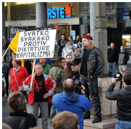
„Protiv diktature kapitalizma!“ -Da, ali čime? – pita SRP

U političkoj teoriji postoje samo dva načina promjene političkog sistema. Trećeg nema. Prvi je revolucija, a drugi političko djelovanje. Prvi je, dakle, nasilna smjena vlasti, a drugi djelovanje kroz institucije sustava... Mislim da ćemo se složiti oko toga da revolucija trenutno nije realna opcija. Za nju nemamo snage. Pogledajte koliko nas se okupilo... Preostaje političko djelovanje, kao jedina realna opcija. Malim koracima do zajedničkog cilja.