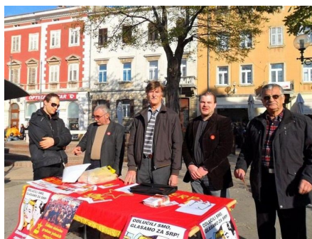
SRP-ovci u Rijeci

od prvih parlamentarnih izbora na kojima je SRP sudjelovao, kada je osvojio blizu 19 tisuća glasova. Pad u odnosu na posljednje izbore iz 2007. godine, kada je SRP bio dio lijeve koalicije, iznosi otprilike 50 posto (glasova), i to ujednačeno u svim izbornim jedinicama (nešto slabiji relativni rezultat u 10. izornoj jedinici duguje objašnjenje dijelom glasova koje je pripalo „konkurentskoj“ listi SPH (nositelj S. Beroš ), što nije bio slučaj u drugim jedinicama). U svjetlu novih okolnosti koje su trebale pogodovati SRP-u, od ekonomske krize, gomilanja nezaposlenosti, antikapitalističkih demonstracija pa do „čišćenja“ na ljevici do kojeg je došlo nestajanjem drugih lijevih stranaka, taj rezultat je pokazao dramatičan pad podrške birača SRP-u. Međutim, nije mudro, a ni korisno, ostati na tom dojmu, i na plitkim analizama širiti defetizam. Posebno se to ne očekuje od marksista. U tom kontekstu, osvrnuli smo se na tri dimenzije preko kojih smo željeli prodrijeti iza prvih impresija.