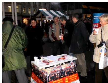
SRP-ovci u Zagrebu

Treće, apsolutna brojka birača SRP-a je sigurno nezadovoljavajuća. Međutim, ne odudara od društvenih i političkih procesa u zemlji, ne „iskače“ u usporedbi sa sazrijevanjem klasne misli naših radnika. Kako onda očekivati radikalnu promjenu u tom broju? Naravno, ne treba podcjenjivati ni činjenicu da se iz istih razloga SRP nosi i s teretom marginalne, vanparlamentarne stranke, pa se ljudi nerado i teško odlučuju pokloniti nam povjerenje, i to u bilo kojoj formi. Pri tome, određene manifestacije nezadovoljstva kapitalizmom vrlo su heterogene i još uvijek daleko od marksističke matrice i stoga nas ne trebaju zavaravati, odnosno biti izvor nekih političkih iluzija. Dakako, iz svega proizlazi da je prijeko potrebno raditi na snažnijem uključivanju radnika u partiju, uvjetovati da ona (partija) sutra politički izraste iz te baze pa će se u jednom trenutku biračka baza „preliti“ iz socijalne baze. Ali za to je potrebno i da sazriju društveni uvjeti, a u međuvremenu SRP mora kontinuirano i sve ozbiljnije pridonositi tim procesima. Međutim, paralelno postoje i oni koji ne vide SRP-u (ili uopće radničkim partijama) mjesto na ovakvim izborima generalno (pa i antiizborne kampanje u nekim gradovima, potaknute takvim razmišljanjem, su nam u jednoj mjeri