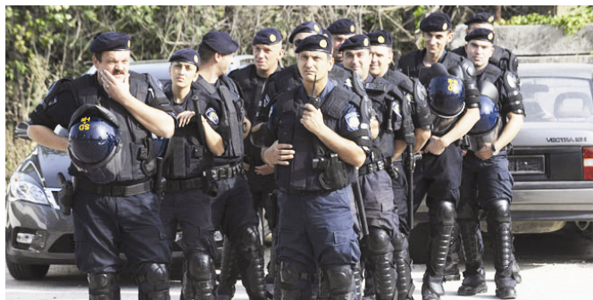
Tu su da „štite tvornicu od radnika“