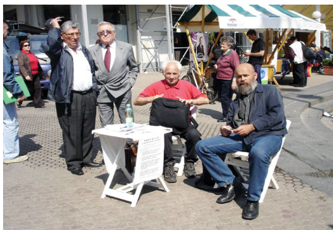
Potpisivanje peticije na Trgu bana Jelačića (gore); prva sjednica Upravnog odbora Udruge „Samodoprinos“ (dolje)

Kod pojedinaca postoji skepsa u vezi realizacije ove ideje. Međutim, postoje pravne i legalne pretpostavke da će u ponovljenoj akciji skupljanja potpisa biti mnogo veći odaziv građana, kao što se očekuje i veliki interes za učlanjenje u Udrugu, što cijeloj inicijativi daje posebnu težinu i osjećaj optimizma. Svakako da predstoji mnogo napora i posla za Udrugu kako bi se postigao željeni uspjeh.