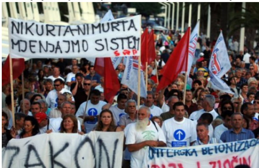
SRP na radničkim demonstracijama u Splitu (rujan 2009. godine)

Zahvaljujući prilikama u kojima živimo, u potpunosti je razumljiv