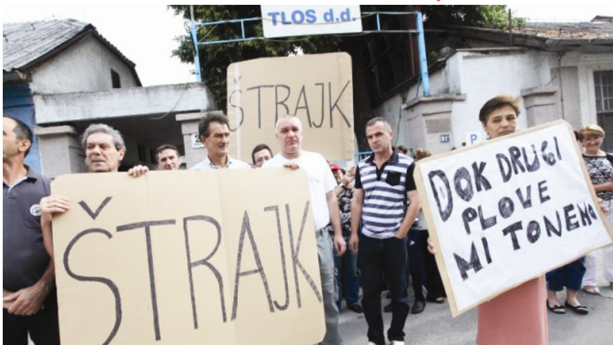
Radnici TLOS-a u štrajku

radnicima koji su svojim radom stvorili novu vrijednost koju su beskrupulozno prisvojili vlasnici, suvlasnici i ini menadžeri. Nedopustivo je da 200 obitelji već nekoliko mjeseci nema mogućnosti za preživljavanje i egzistenciju. Kad bi Vaš slučajbio usamljen u Hrvatskoj, to bi se moglo svesti pod aktualne poteškoće u poslovanju, ali brojni primjeri, od brodo-gradilišta, Salonita, Sinjanke, Dalmatinke, Đakovštine, TDZ-a, Croatia Airlinesa, Jedinstva, poljoprivrednika i drugih, ukazuju na dublje korjene problema.