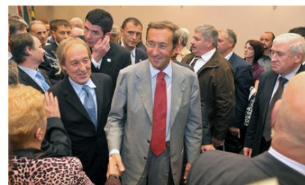
Generalni konzul Italije u Hrvatskoj, Furio Radin i Gianfranca Fini

Povodom službenog posjeta Gianfranka Finia Hrvatskoj, Socijalistička Radnička Partija daje sljedeću izjavu: Službeni posjet predsjednika Zastupničkog doma Parlamenta Republike Italije Gianfranca Finia Saboru RH i Puli, gdje će se sastati sa predstavnicima talijanske nacionalne skupnosti, podigao je dosta prašine i uzjogunio je „dušebrižnike“, koji „bdi-ju“ nad integritetom i suverenitetom Republike Hrvatske. Oni svoju uznemirenost zasnivaju na Finijevoj političkoj prošlosti, njegovoj pripadnosti neofašističkim krugovima u okviru nekadašnje stranke Movimento sociale , njegovim stavovima o Benitu Musoliniju , tvorcu i vođi fašističkog pokreta u Italiji, koje je imalo teške i tragične implikacije na život, na slavevskom dijelu Jadranske obale i dijelovima unutrašnjosti, između dva i tokom II. svjetskog rata, kao i na recentnim izjavama ovog kontroverznog političara, nakon njegove političke evolucije i distanciranja od fašističkog pokreta, u kojima tretira ove prostore.