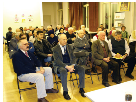
Detalji s promocije

knjige Salamona Jazbeca „Sociologija hrvatskog revizionizma“, koja je nastavak prethodne knjige o povijesnom revizionizmu iz 2008. godine. Nakladnik knjige je Margelov institut, a tiskana je uz financiranje Ministarstva kulture Republike Hrvatske.