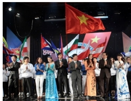
Mladost koja ne poznaje granice želi i živjeti u takvom svijetu

lizma, imperijalističkom okupacijom, ili koji žive sa posljedicama agresije. Isto tako data je podrška revolucionarnoj omladini cijeloga svijeta u borbi za pravednije društvo. Nakon festivala naša delegacija objavila je i zajedničku deklaraciju u cilju poticanja daljnje zajedničke suradnje i nastavka revolucionarne političke borbe na nekadašnjem jugoslavenskom prostoru. Važnost samoga festivala nije pro-makla reakcionarnim snagama pojedinih zemalja. 11 članova delegacije Zapadne Sahare uhapšeno je,