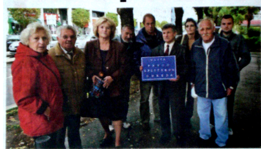
Predstavnici SRP-a postavili su ploču s imenom ulice u čast partizanima.