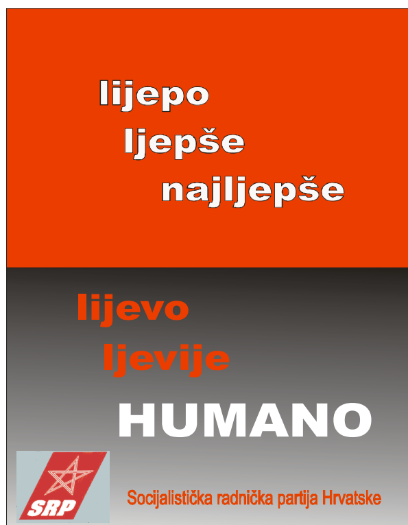
Plakat Gradske organizacije SRP-a Zagreb za lokalne izbore 2005. godine

vlasti, ali se gospodarska situacija nije bitno mijenjala – najkraće rečeno, još uvijek je to vrijeme rasta i povećane potrošnje koji nisu dolazili iz realnih izvora proizvodnje i stvaranja viška vrijednosti, nego iz ulaganja u potrošnju i zaduživanja. SRP je nastupio samo u četiri županije (Zagrebačka, Primorsko-goranska, Istarska i Grad Zagreb) te u trinaest gradova i općina. Dobiveno je 8.070 glasova na županijskoj razini (1,5 posto od ukupnog broja glasova ljudi izašlih na izbore u tim županijama) te 2.530 glasova na općinskoj i gradskoj razini (1,6 posto).