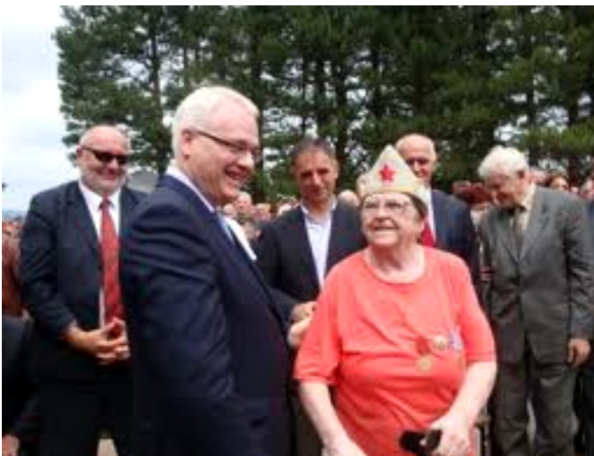
Sve ima svoju cijenu pa i osmijeh - čini se da će nas „reafirmacija antifašizma“ skupo koštati

SDP-ovi političari se vole distancirati od svakog totalitarizma, posebice komunističkog, dok svaku samovolju i nedemokratsko nametanje vlastitih stavova od strane raznih grupa ili pojedinaca redovito nazivaju staljinizmom. No upravo su oni ovih dana na velika vrata uveli tzv. staljinističke metode u rad SABA. Naime, svi članovi antifašističke udruge koji su se prošle godine suprotstavili ideji odlaska na Bleiburg i Tezno su eliminirani iz svih tijela budućeg rukovodstva SABA. Groteska je bila tim veća jer su s kandidacijske liste, usprkos nasušnoj potrebi pomlađivanja organizacije, maknuti čak i predstavnici Mladih antifašista. Mladi dvadesetogodišnji antifašisti su zamijenjeni krepkim šezdesetogodišnjim ili starijim antifašistima i antifašistkinjama.